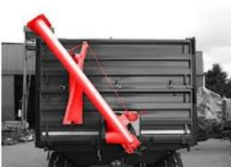
Závitovka na osivo 2+2 m pracujúca pod uhlom 45 stupňov