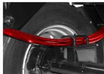
Parabolické odpruženie zabezpečuje stabilitu jazdy