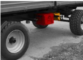
Box na náradie