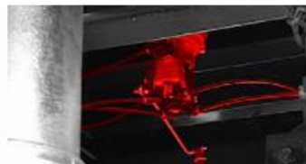
Záťažový regulátor ALB