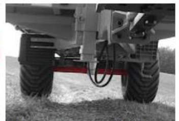
Náprava je vyrobená z ocele ST-52