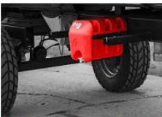
Nádrž na vodu s dávkovačom mydla