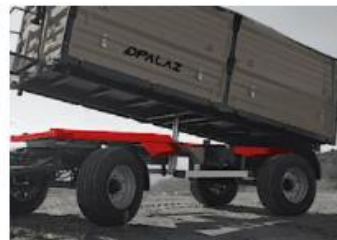
Nosná rám rám je vyrobený z kvalitnej ocele triedy ST-52