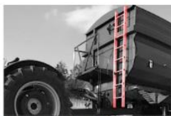
Rebrík Je súčasťou každého CARGA