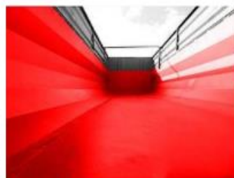
Korba má hrúbku 4 mm na požiadanie 5 mm s ocele ST-37