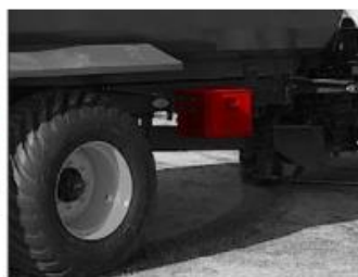
Box na náradie Cargo