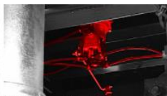
Záťažový regulátor ALB