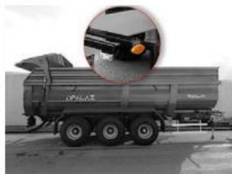
Obrysové svetlá podľa EU homologizácie