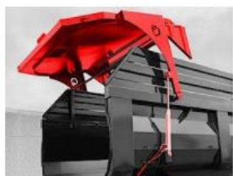
Hydraulicky ovládané zadné čelo