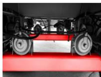
Nápravy z vysokokvalitnej ocele ST-52