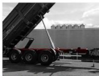
Rámy a šasy s ocele ST-52