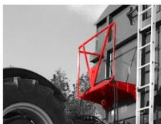
Manipulačná plošina vpred