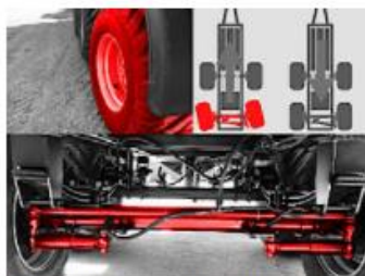
Voľne natáčacia zadná náprava s blokovaním pri cúvaní