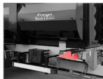
Klíny pod kolesá CARGO