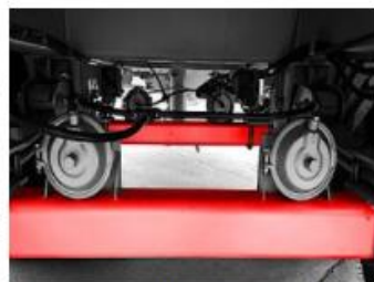
Nápravy z vysokokvalitnej ocele ST-52