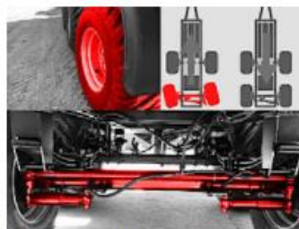
Volne natáčacia zadná náprava s blokováním pri cúvaní