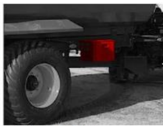
Box na náradie Cargo