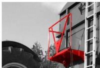
Manipulačná plošina vpredu