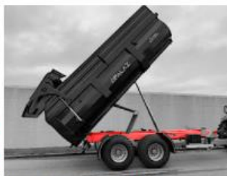
Masívny rám z ocele ST-52