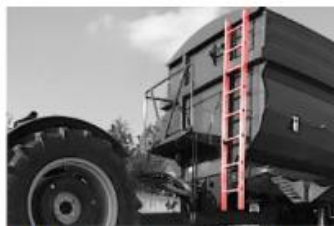
Rebrík Je súčasťou každého CARGA