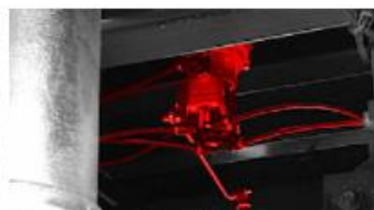
Záťažový regulátor ALB