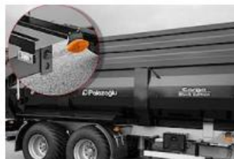
Obrysové svetlá a odrazky podľa EU homologizácie