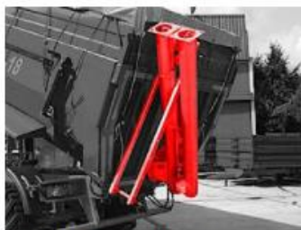
Závitovka 2+2 s uhlom 45°