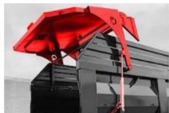
Hydraulicky ovládané zadné čelo