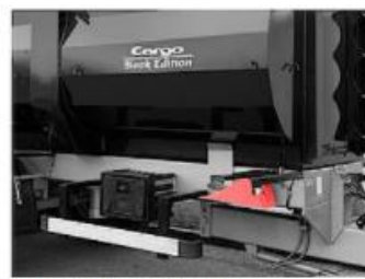
Kliny pod kolesá CARGO