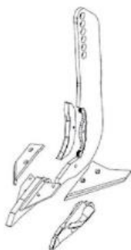
miešacia radlička Trio