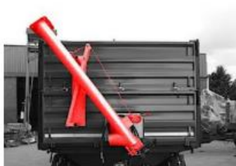
Závitovka na osivo 2+2 m pracujúca pod uhlom 45 stupňov