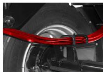
Parabolické odpruženie zabezpečuje stabilitu jazdy