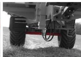
Náprava je vyrobená z ocele ST-52