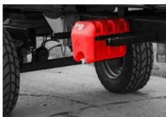
Nádrž na vodu s dávkovačom mydla