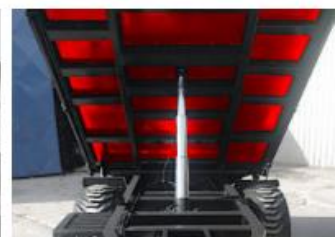
Podlaha s hrúbkou 4 mm.