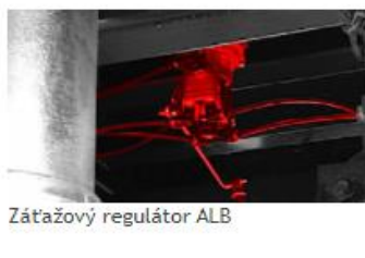
Záťažový regulátor ALB