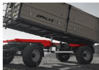
Nosná rám rám je vyrobený z kvalitnej ocele triedy ST-52