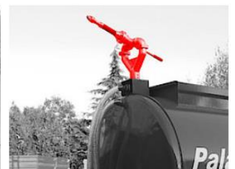
Vodné delo pre hasenie