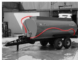
2" hadicové vedenia