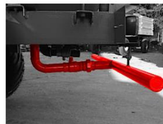
Kropiaci rampa vzadu