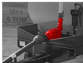
Odstredivé čerpadlo poháňané kardanom