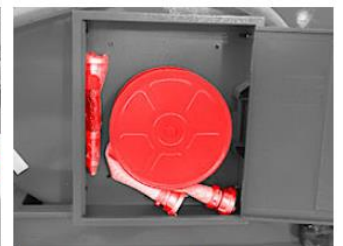
Box s hasičskou hadicou