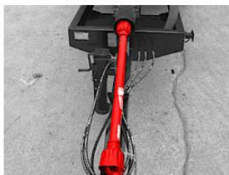
Kardan pohonu čerpadla