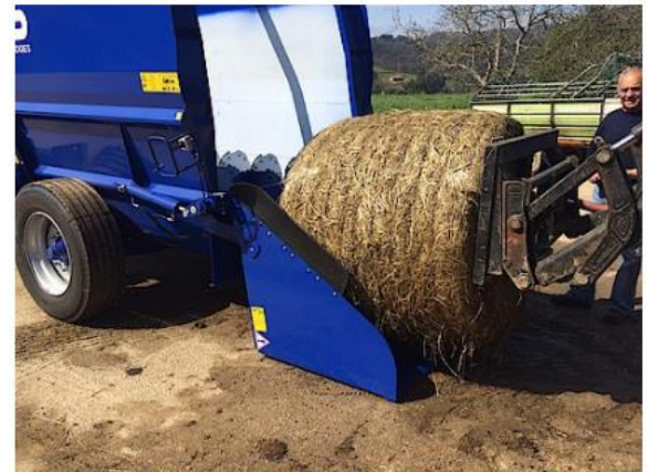
Dvojšnek si hravo poradí aj s celými balíkmi.