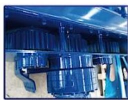
Pohon šnekov cez ozubené súkolesia v olejovej náplni. Žiadne reťazové prevody.