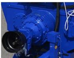
Robustná redukčná prevodovka RBS Brevini 2215