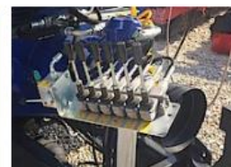
Ovládanie pomocou bowdenov