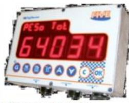
Vážiace zariadenie DigiDevice