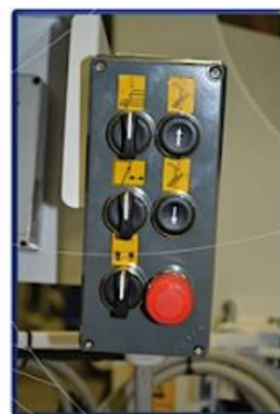
Elektronické ovládanie miesta bowdenov